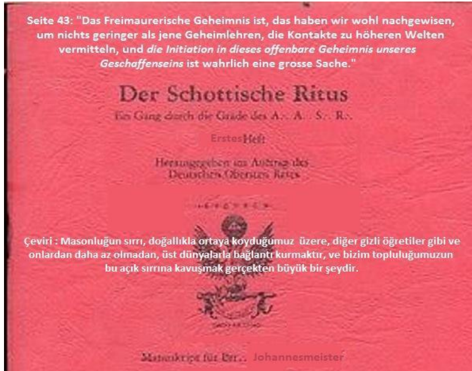
Şekil 5. Masonik sır.