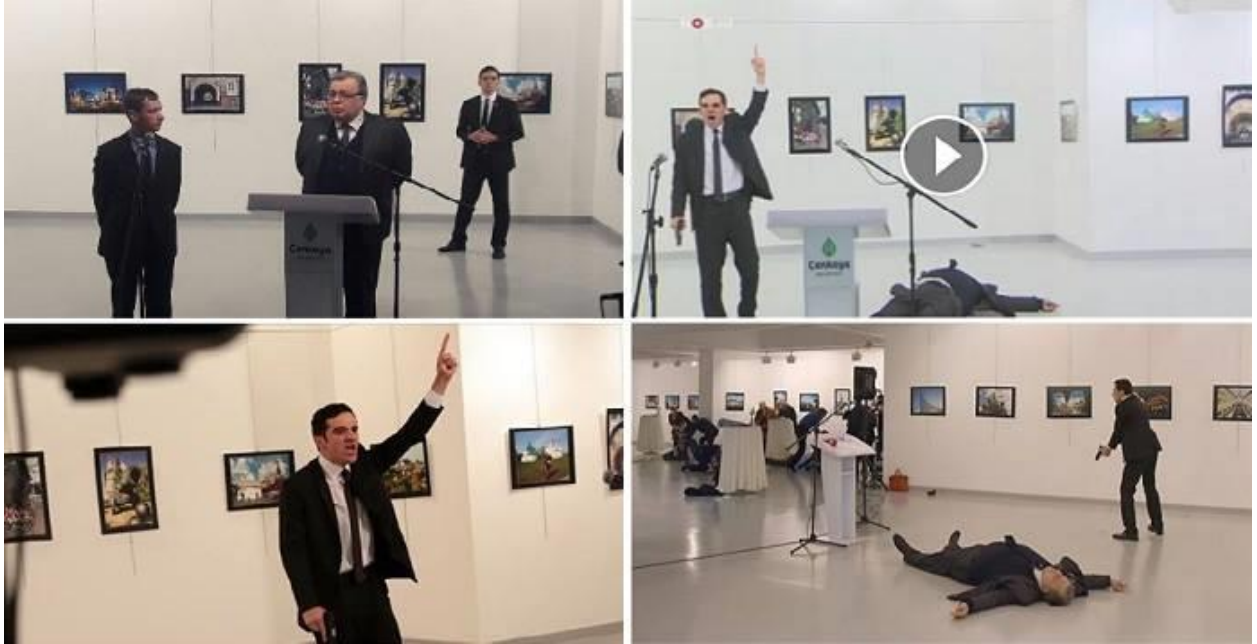
Şekil1. Güncel bir örnek.

Psikoloji, sosyoloji vb. bir pozitif bilim olarak kabul edilmezler çünkü bu alanlarda denetimli deney olanağı sağlamak çok zordur; Pavlov koşullu refleks olayı için bir deney düzeniği kullanmıştır, Milgram Deneyi keza oldukça yinelenebilir ama bir kez uygulanmış olması ikinci uygulamayı etkiler niteliklidir [103], [104]